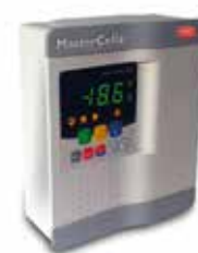
inclusief digitale regelaar